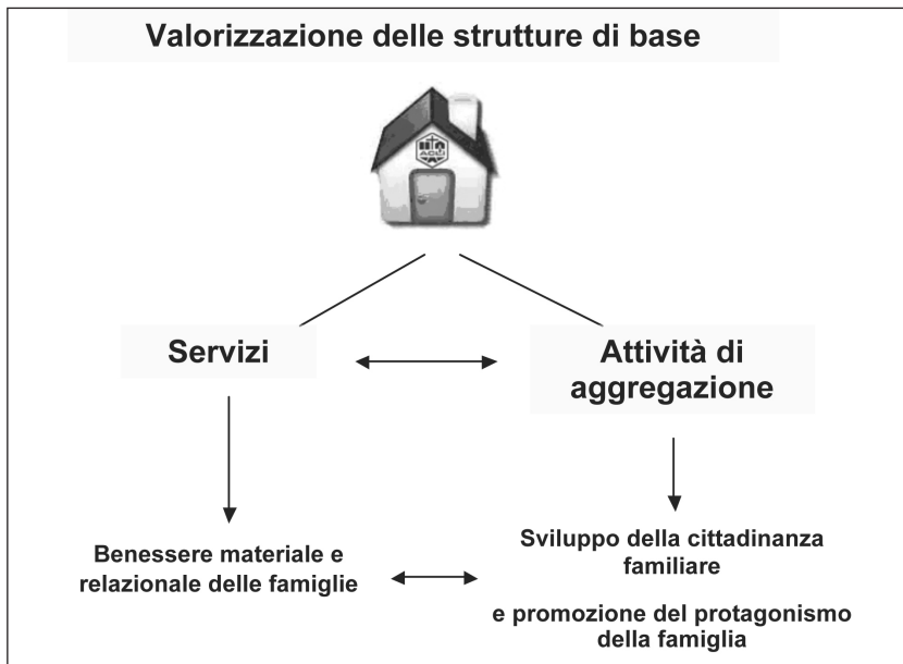
Fig. 3 - Specificità del Punto Famiglia delle Acli

All'interno di questa filosofia, i dieci passi da compiere per aprire un Punto famiglia sono, in estrema sintesi: